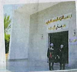
PEMANDANGAN laluan masuk ke kilang kiswah di Mekah.

Antara kalimah atau ayat yang tertera dalam pintalan emas kiswah ialah syahadah, surah Ali Imran ayat 96, al-Baqarah ayat 144, surah al-Fatihah dan surah al-Ikhtlas.