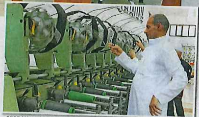
SEORANG pekerja menyiapkan proses melibatkan pintalan benang.

Hanya sebahagian kecil penghasilan kain menggunakan