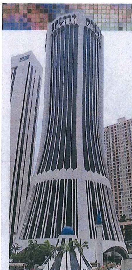
Tabung Haji antara GLC yang boleh dijadikan organisasi korporat bilionair dalam memperkasa masa depan ekonomi Melayu.