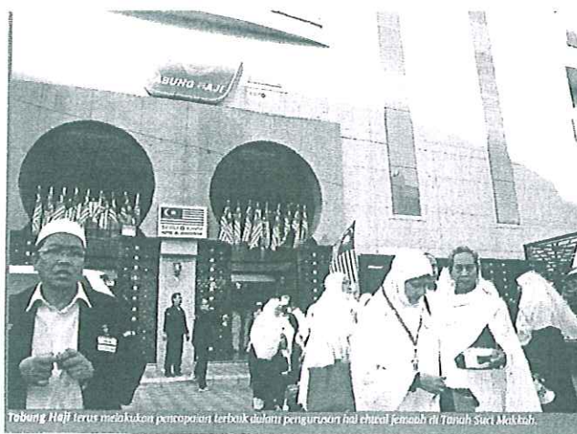
Tabung Haji terus melakukan pencapaian terbaik dalam pengurusan hal ehwal jemaah di Tanah Suci Makkah.