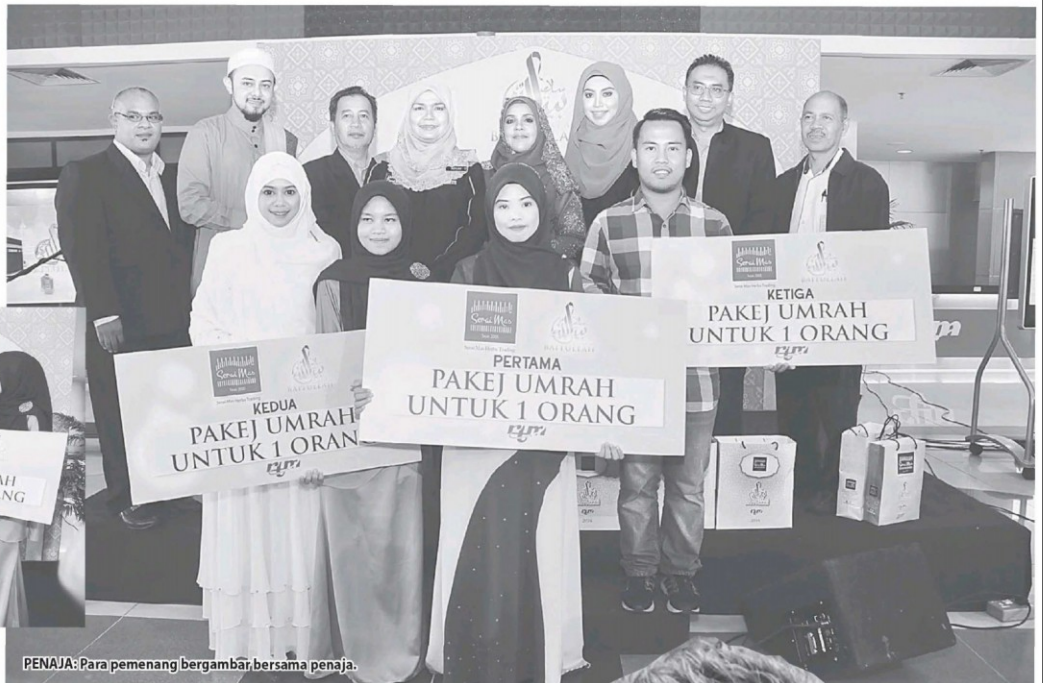
PENAJA: Para pemenang bergambar bersama penaja.

Menurut penerbit program, Rohani Musa, Salam Baitullah mendapat sambutan yang