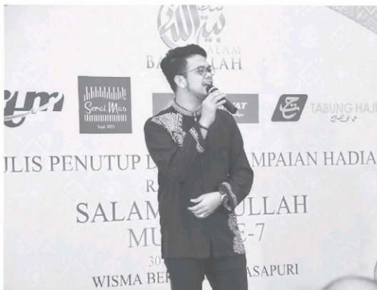
MENGIHIBURKAN: Salah seorang artis yang membuat persembahan.