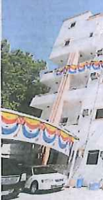
Pusat Rawatan Syisyia memberi perkhidmatan kesihatan dan rawatan kepada jemaah haji di Makkah.