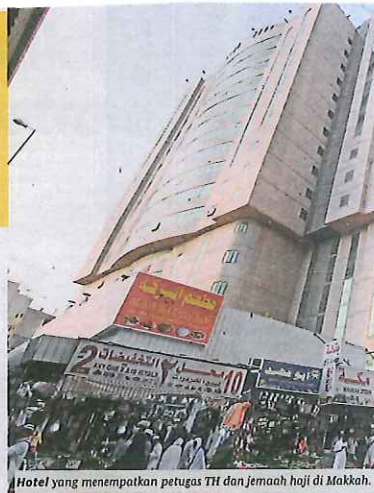
Hotel yang menempatkan petugas TH dan jemaah haji di Makkah.

TH juga membuat perjanjian penyewaan 12 hotel - sembilan di Makkah dan tiga di Madinah untuk menempatkan jemaah haji. Jarak hotel dari Masjidil Haram tidak lebih daripada 1,000 meter, manakala di Madinah pula tidak lebih 150 meter dari Masjid Nabawi, sekali gus mem-