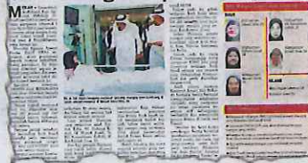
KERATAN Kosmo/17 September 2015.

berkenaan sebanyak SRI juta (RM1.1 juta) pada 16 September tahun lalu.