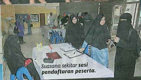
Suasana sekitar sesi pendaftaran peserta.

Beliau yang juga pembaca setia BH, berkata program yang dijalankan dengan kerjasama akhbar itu memberi peluang beliau mengetahui peluang mempromosi