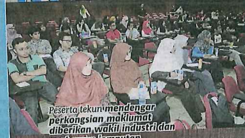
Peserta tekun mendengar perkongsian maklumat diberikan wakil industri dan usahawan jemputan.