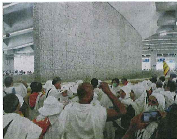
SEBAHAGIAN jemaah haji membuat lontaran pertama di Mina semalam.