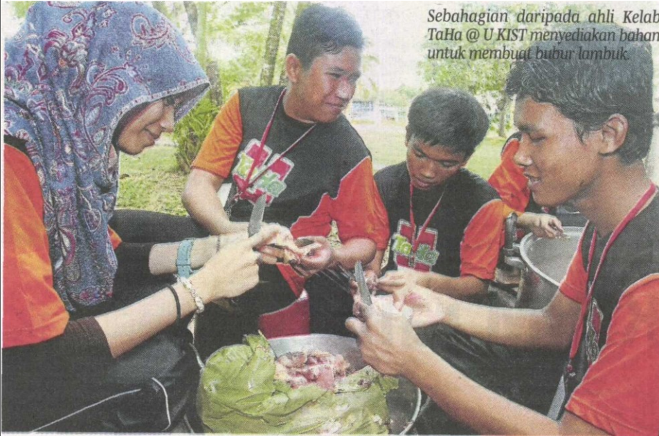
Sebahagian daripada ahli Kelab TaHa @ U KIST menyediakan bahan untuk membuat bubur lambuk.