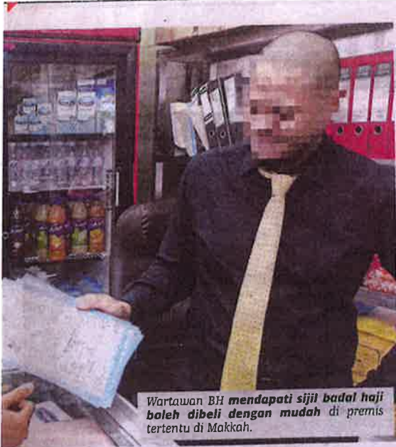
Wartawan BH mendapati sijil badal haji boleh dibeli dengan mudah di premis tertentu di Makkah.

Ikuti BH Plus di www.bharian.com.my untuk lebih gambar dan video