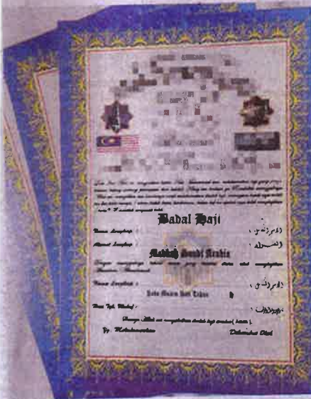
Sijil badal haji yang boleh dibeli dengan hanya RM3.40 sekeping di premis tertentu di Makkah.

boleh menunaikan satu badal haji dalam satu musim.