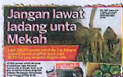
KERATAN Kosmo/19 Februari 2015.

ini jangan ada yang senyap-senyap cuba mengadakan lawatan ke ladang unta melainkan sekiranya dibenarkan pihak berkuasa Arab Saudi.