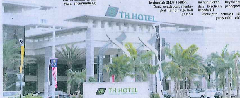
Grafik: Harian Metro, Fahmy Hashim

13 peratus berbanding 2012 berjumlah RM38.3 bilion. Dana pendeposit meningkat hampir tiga kali ganda