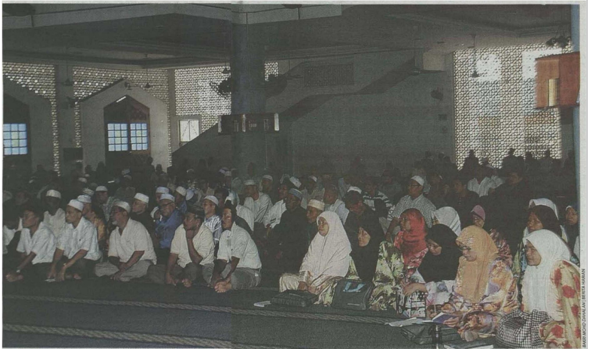
SEBAHAGIAN daripada peserta Kursus Asas Haji 1432 Hijrah yang diadakan di Masjid Jamek Tan Sri Ainuddin Wahid Taman Universiti.

Language Malay Page No 4,5 Article Size 489 cm 2 Color Full Color ADValue 12,869 PRValue 38,607