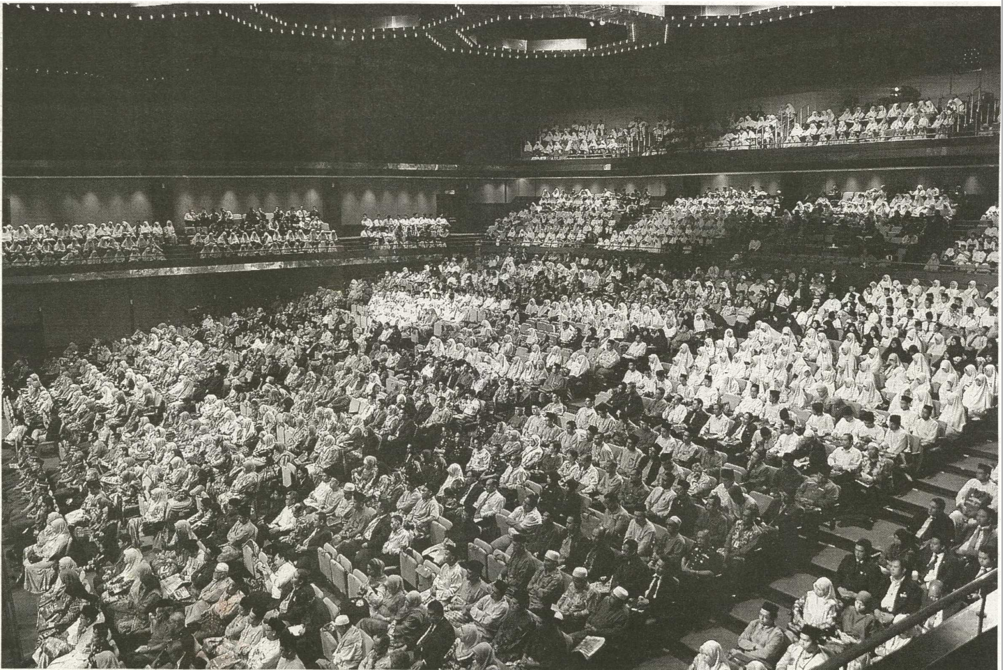
ORANG ramai yang hadir pada majlis perasmian Karnival Transformasi Sistem Pengurusan Islam di Malaysia di PWTC, semalam.